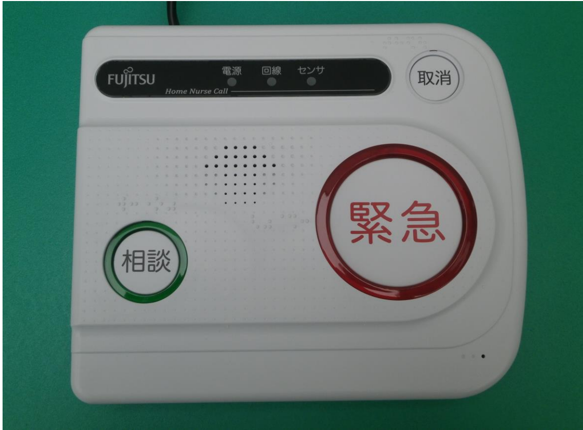
①装置本体「富士通 ホームナースコール」