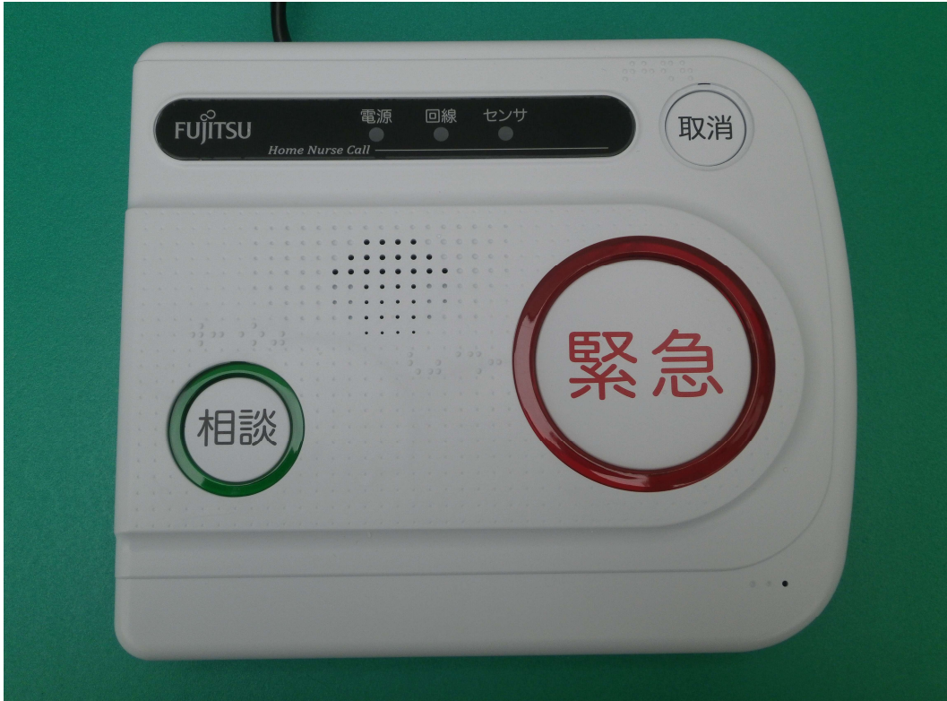
①装置本体「富士通 ホームナースコール」