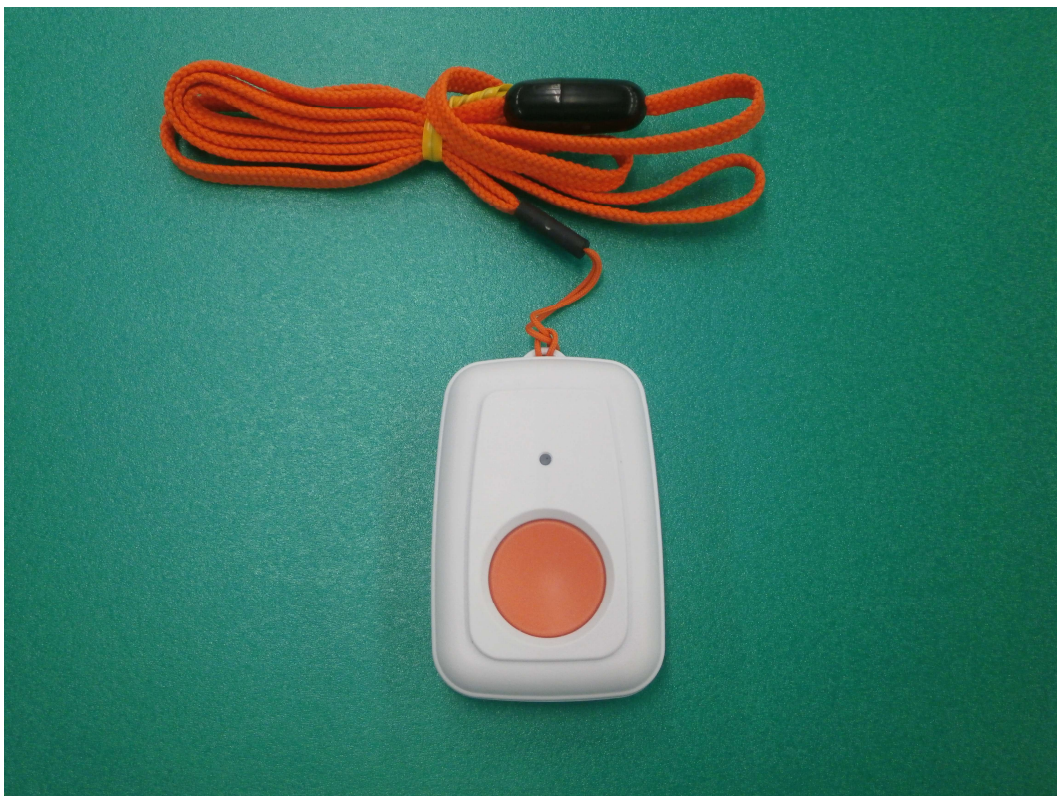
②ペンダント型ワイヤレス通報装置（1台のみ） ご自宅内のみで利用できます。

※①、②どちらの装置も委託業者が取付け設置（貸与）します。紛失・再発行の場合、費用がかかる場合があります。