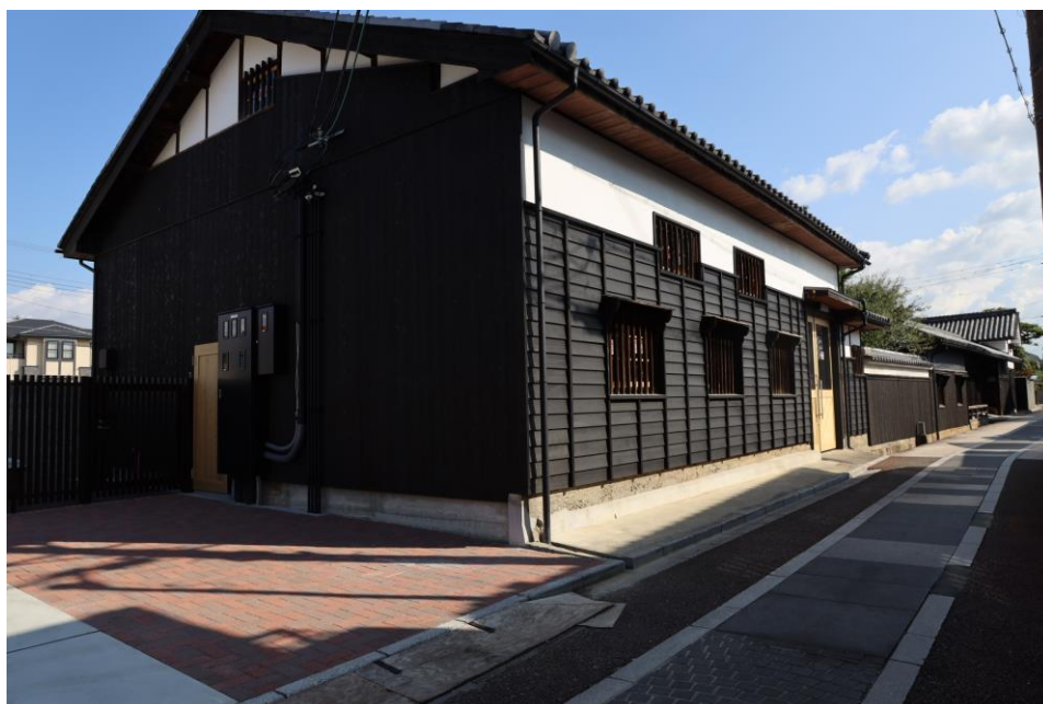
【旧浅野家住宅（竹内街道側から）の写真】

羽曳野市では現在、江戸時代後期に油絞業が営まれ、明治時代には酒造業に転じるために酒蔵の建築が行われた歴史的価値の高い家屋である旧浅野家住宅を観光に来られた方や地域の皆さんが気軽に利用していただけるような「観光交流拠点」にするため、整備を進めています。今回、亀谷窯業と石州瓦工業組合の協力のもと、タイルに絵付けをするワークショップを旧浅野家住宅で開催します。絵付けして焼き上げたタイルは、旧浅野家住宅の広場の飾りに使用されます。また後日、絵付けして焼き上げたタイル1枚を記念に進呈します。