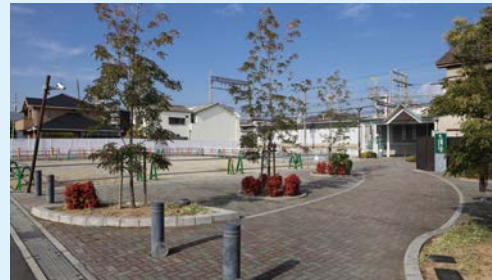
恵我ノ荘駅前南側広場

西浦東幼稚園・白鳥幼稚園・西浦幼稚園・軽里保育園を再編・統合する（仮称）第4こども園について、民設民営による公私連携幼保連携型認定こども園として令和10年度の開園をめざします。