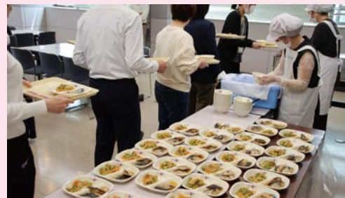
給食試食会の様子