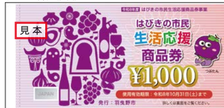
チケット本券（表面）

問合せ はびきの市民生活応援商品券コールセンター ☎ 072-947-0112（平日9:00～17:00）