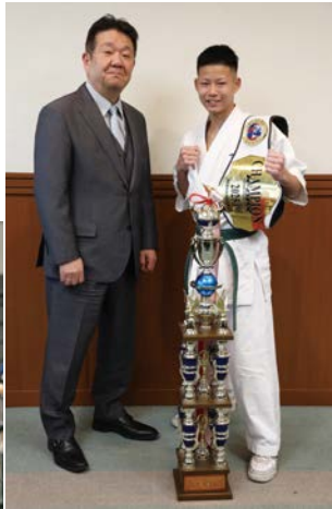
▲3月11日(水)市役所にて