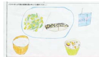
さばのごま焼き、具だくさんのみそ汁など。テーマは、秋の食材で勉強もスポーツもがんばれる力が湧いてくる献立(升本さん)