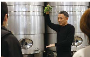
▲ワイナリー見学風景【河内ワイン】

2025年度から、大阪府の宿泊税を活用する観光振興を進める事業が始まり、今年度もさらにその2つの事業の充実を図ります。1つ目は大阪観光局が持っている観光客の人流や消費データを可視化し、効果的な商品造成等の実現につなげる事業。2つ目は観光コンテンツの販売を、海外に向けて発信するデジタルプロモーションです。羽曳野でしか体験できない魅力的なコンテンツを造成し、インバウンドで日本を訪れる訪日外国人が、旅前や旅中にオンラインで購入できる仕組みなどを構築します。现阶段では、少しずつ予約が入るようになりましたが、試行錯誤を重ねながら、さらに多くの外国の方々目に留まるように進めてまいります。