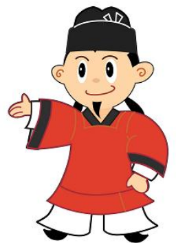
藤井寺市公式キャラクター「まなりくん」

従業員は、金融機関に出向いて納税する手間が省け、納付を忘れて滞納となったり、延滞金がかかることはありません。また、年税額を4回で支払う「普通徴収」と比べ、「特別徴収」は12回払いとなるので1回あたりの税負担が少なくなります。