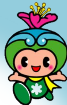
富田林市の イメージキャラクター 「とっぴー」