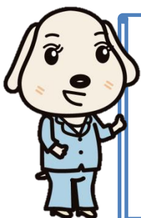
大阪府税のキャラクター「みらい」