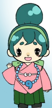
河南町のカナちゃん