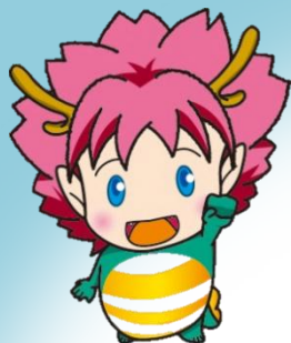
大阪狭山市の マスコットキャラクター 「さやりん」