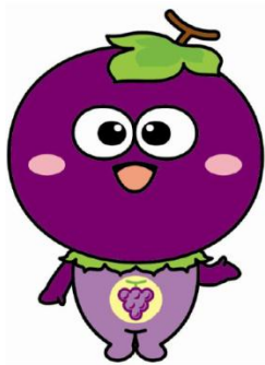
羽曳野市ご当地キャラクター「つぶたん」

給与を支払う事業主の方は、毎年4月1日現在に在職するパート・アルバイトなどを含む従業員全員を対象に特別徴収していただくこととなっています。したがって、従業員の希望により納入方法を選択することはできません。（*中途就職者など、他の事業主から給与を受けた方も対象となります。）ただし、給与が毎月支給されないなどの場合は、特別徴収する必要はありません。