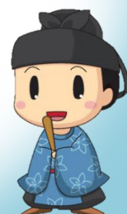
太子町のキャラクター 「たいしくん」