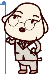
大阪府税のキャラクター「タッピー」