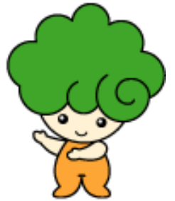
河内長野市のシンボルキャラクター「モックル」

所得税の源泉徴収義務のある事業主は、従業員の個人住民税を特別徴収することが法律（地方税法第321条の4）により義務づけられています。