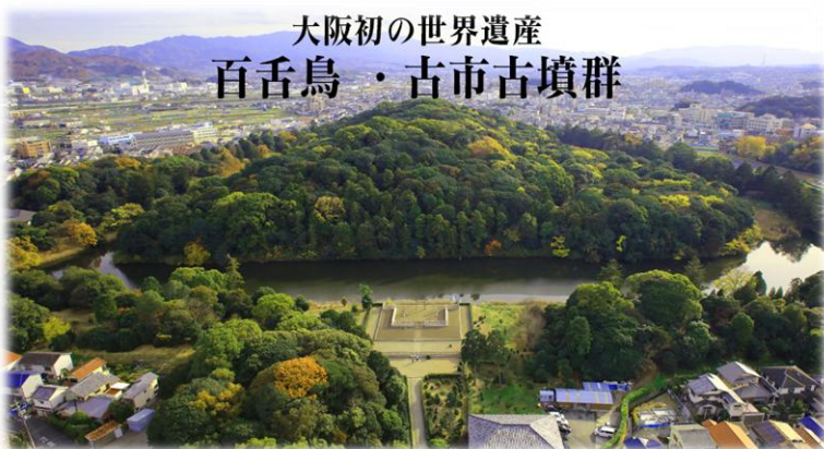
大阪初の世界遺産 百舌鳥・古市古墳群