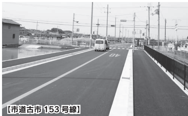
【市道古市 153 号線】