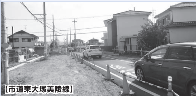
【市道東大塚美陵線】