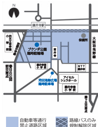
▼自動車等通行禁止区域