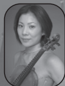
馬淵清香 (ヴァイオリン)