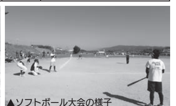
▲ソフトボール大会の様子