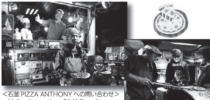
<石釜 PIZZA ANTHONY への問い合わせ> Mail : pizza.anthony0141@gmail.com