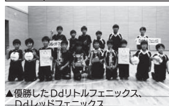
▲優勝したDdリトルフェニックス、Ddレッドフェニックス