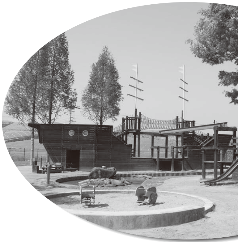
羽曳野市立 グレープヒルスポーツ公園野外活動広場 "ふれ愛広場"