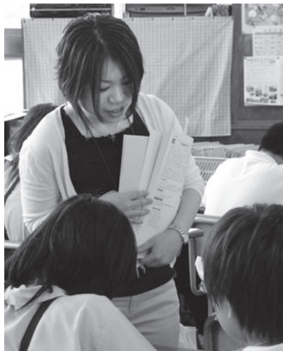
外国語活動でのサポート職員

「サポート職員」は今年度に採用した新規採用職員を中心としており、子どもたちのコミュニケーション能力の素地を養うとともに、積極的に外国語とふれあう場づくりをめざしています。