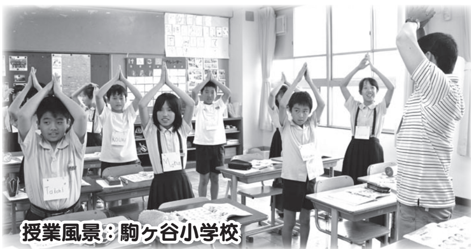
授業風景：駒ヶ谷小学校