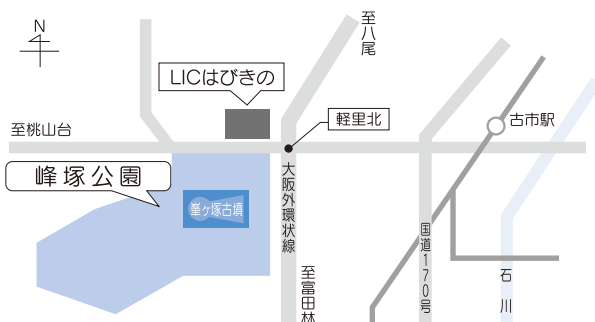
峰塚公園およびLICはびきの周辺地図

* 当日市役所・陵南の森・はびきのコロセウムに駐車場を設けていますので、お車の方はそちらでシャトルバスに乗り換えて会場にお越しください。 (なお、コロセウムの駐車場は2時間を超えると有料になります。)