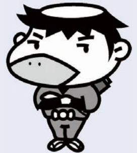
大阪府生活排水対策キャラクター かつば忍者 せせらぎ

また、飲食店や旅館などでも、日頃から水の汚れを減らすための取り組みをお願いします。