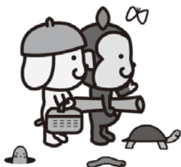
「大阪府エコアクションイメージキャラクター」