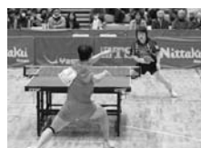
▲昨年の大会の様子