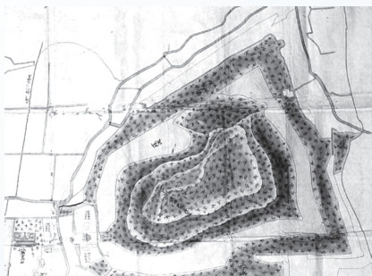
▲江戸時代に描かれた応神天皇陵古墳