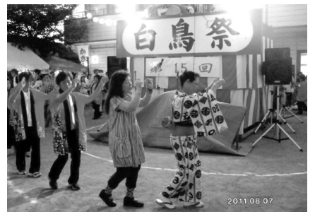
(白鳥会館 ☎ 958-4171)