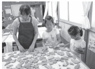
▲古墳群の話や、土器・埴輪に実際にふれて古市古墳群の魅力を学びました。

定員 子ども・大人 各10人 (先着順) 費用 材料費・保険代は実費 会場 文化財整理室