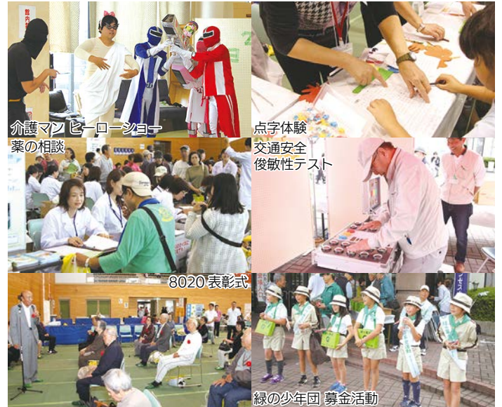
介護マンヒーローショー 業の相談

10月20日(日)、はびきのコロセアムで「ふれあい健康まつり」が開催されました。健康づくり講演会をはじめ、体力測定や健康相談など、豊富な催しがあり、約3,000人が健康を考える機会となりました。