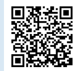
(健康教室のお知らせ)