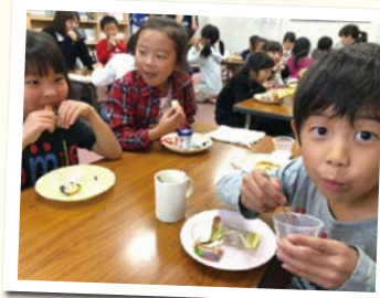
みんなでおやつの時間♪