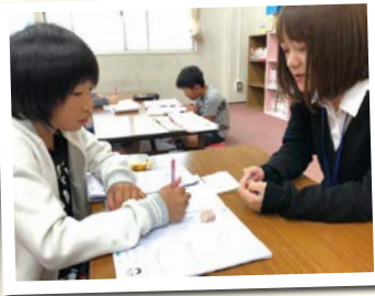
わからないところは 一緒に考えよう! (市職員による学習支援)