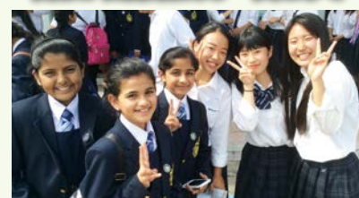
インドや台湾など海外の高校生との交流