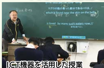
ICT機器を活用した授業