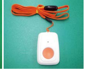
▲ペンダント型ワイヤレス 通報装置