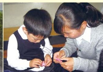
1～9年生での広島平和 公園へ捧げる折鶴づくり

◆就学手続き◆ ※広報11月号にも掲載 就学指定校の変更申請書(学校教育課窓口で 配布)を学校教育課に提出(締切12月20日(金))