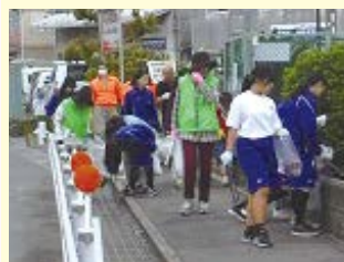
～校区クリーンアップ～ 地域の方と校区の清掃活動