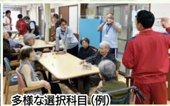
多様な選択科目(例)

(サービスラーニング) 地元のグルー プホームで入所者の方々とふれあい、 介護補助などを行いました。