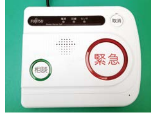
▲装置本体 「富士通ホームナースコール」