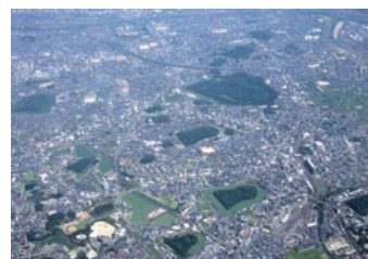
▲ 世界文化遺産を目指す古市古墳群