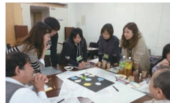
▲ 総合基本計画 市民ワーキング会議