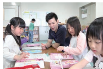
▲ 留守家庭児童会の風景