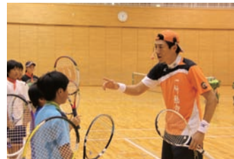
▲ NHKスポーツパーク 松岡修造さん