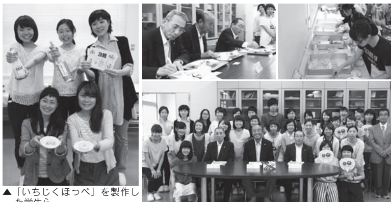
▲「いちじくほっぺ」を製作した学生ら

7月7日(火)、特産品のイチジクを使ったスイーツを、管理栄養士を目指す大阪府立大学の学生らが開発し、競い合う審査会が、同大学羽曳野キャンパスで行われました。6つの作品から、最優秀賞に選ばれた「いちじくほっぺ」は早ければ年内にも商品化される予定です。いちじくほっぺは、焼きドーナツなのにモチモチでふわふわの食感で、イチジク以外には市内にある醸造所の白ワインが使われているそうです。