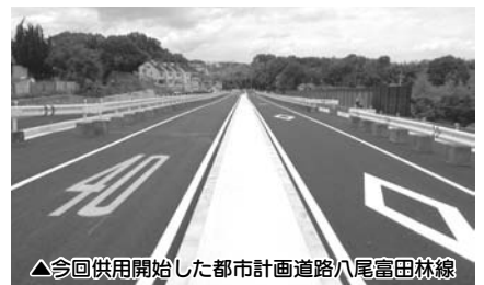
△今回供用開始した都市計画道路八尾富田林線

大阪府が事業を進めている都市計画道路八尾富田林線(事業中区間:市道郡戸古市線～南阪奈道路)のうち、1期区間である市道郡戸古市線から市道河原城羽曳が丘西1号線までの延長約500mが、府道西藤井寺線として7月1日に供用開始されました。