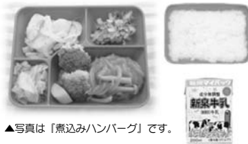
▲写真は「燕込みハンバーグ」です。

成長期にある中学生の心身の健全な発達や食に関する正しい理解と適切な判断を養うとともに、家庭の子育て支援と食育の推進を図ることを目的としています。