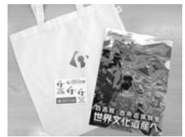
▲エコバック・クリアファイル・ステッカー

問合せ 百舌鳥・古市古墳群世界文化遺産登録推進本部会議事務局 ☎ 06-6210-9742