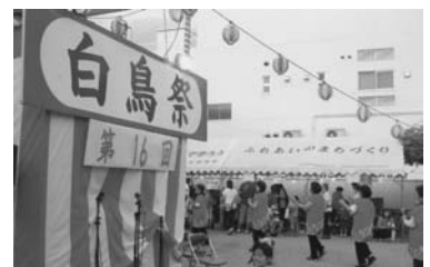
◀ 昨年の「白鳥祭」の様子