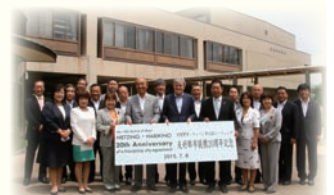
ウィーン市13区ヒーティングとの友好交流都市20周年