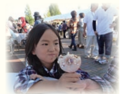
初恋ドーナツコンテスト