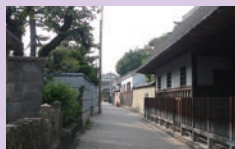
街道・古民家部門 最優秀作品