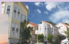
その他まちなみ部門 最優秀作品