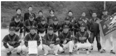
▲ B級優勝：虎穴ヤンキース