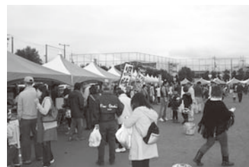
第12回むかいのミートミートフェア、ふれあいステージ (お肉の重さ当て) の様子。第13回も数多くのコーナー、屋台などで楽しんでいただけます。

後援 近畿農政局・大阪府・羽曳野市・羽曳野市教育委員会・羽曳野市観光協会・羽曳野市人権啓発推進協議会・世界人権宣言羽曳野連絡会議・羽曳野市企業人権連絡会・羽曳野市雇用開発協会・羽曳野市商工会・(株)みのりの里・大阪南農業協働組合・(医) 植生診療所・NPO法人サポートネットワークぬくもり