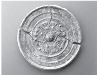
▲庭鳥塚古墳出土 三角縁神獣鏡