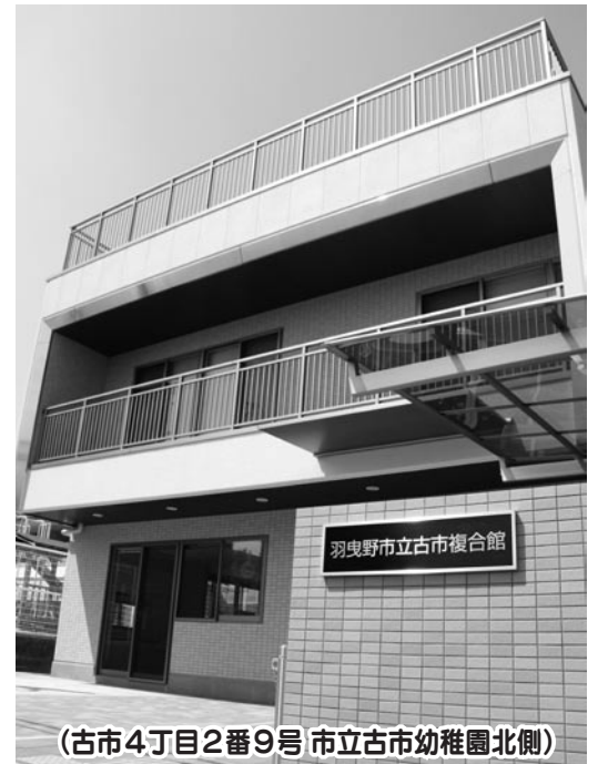
(古市4丁目2番9号 市立古市幼稚園北側)