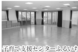
子育て支援センターふるいち