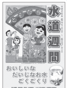
第56回水道週間ポスター