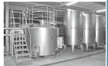
最新式の発酵機器。工場内には以前使用されていた大樽などがあり、河内ワインの歴史が感じられる空間です。