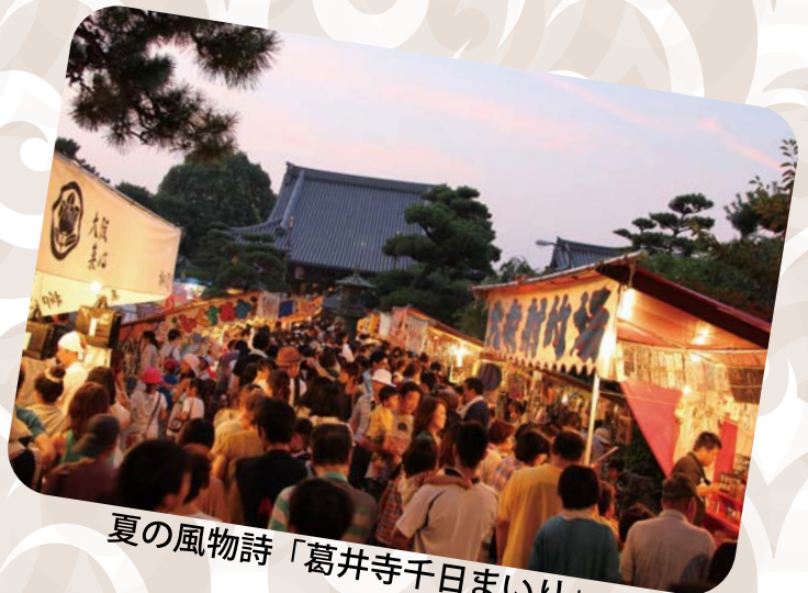
夏の風物詩「葛井寺千日まいり」