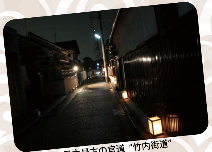
日本最古の官道“竹内街道”

この夏、ご当地グルメをテーマに3市町の風土と高校生のひと夏の青春を描いた映画が撮影されます。乞うご期待！