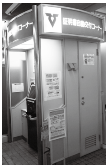
▲証明書自動交付機によるサービスは3月31日をもって廃止します。