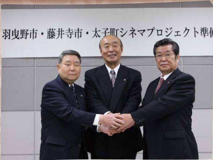
羽曳野市・藤井寺市・太子町シネマプロジェクト準備