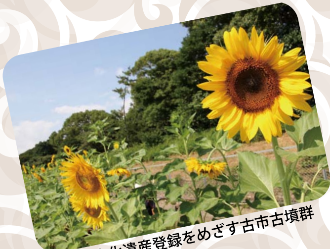
世界文化遺産登録をめざす古市古墳群