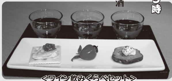
＜ワイン飲みくらべセット＞

夜の部 午後5時30分～午後9時 ・ 地元食材を活かした料理 ・ 羽曳野産ワイン・梅酒 ・ 羽曳野市交流都市などの日本酒 ・ オーストリア産ワイン など