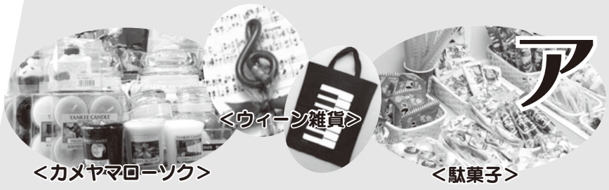
＜カメラマローソク＞