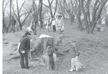
▲第5回ウォーク&クリーンの様子

「古市古墳群」の大きさを身近に感じていただくとともに、これらを守り、伝えるために、清掃活動しながら古墳を巡っていただきます。誉田八幡宮に収蔵されている国宝（金銅透彫鞍金具など）の見学後、各古墳では文化財担当職員による詳しい説明を行います。