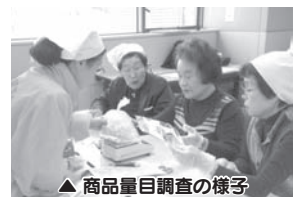
▲商品量目調査の様子

本市では、市内スーパーマーケットなどで販売されている食肉、魚介類、野菜などについて、商品に表記された内容量が適正であるかどうか商品量目調査を実施しています。