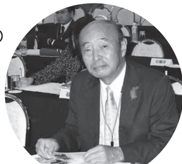
第4回平和首長会議 国内加盟都市会議にて (平成26年11月10日～11日)

唯一の被爆国として世界の国々との連携を計り、国際的機運がさらに高まるよう取り組んでいます。