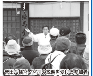
菅田八幡宮で宮司の説明を受ける参加者

3月15日(日)、世界文化遺産の登録を目指している古市古墳群周辺の清掃を行おうと、約130人が金バサミやゴミ袋を持ち、沿道などに落ちているタバコの吸殻や空き缶などを拾い集めました。当日はやや冷え込みましたが、4.3kmの道のりを3時間余りかけて、元気よく歩きました。途中、菅田八幡宮に立ち寄り、拝観庫に保管されている、国宝『金銅透彫鞍金具(菅田丸山古墳)』を見学したり、市職員(羽曳野市・藤井寺市)