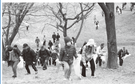
古室山古墳墳丘での清掃活動

から古墳などに関する説明を受けました。このような活動を多くの方に知ってもらい、皆さんとともに世界文化遺産の登録をめざしてまいります。