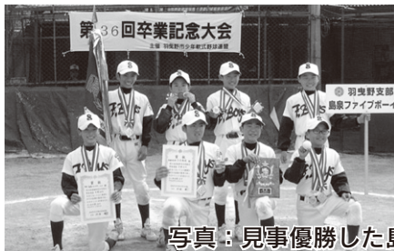
【準優勝】 羽曳野ブラックイーグルス 【第3位】 羽曳野イーグルス

2月1日(日)～22日(日)までの間、9チームによって熱戦が繰り広げられました。見事優勝を勝ち取ったのは接戦を制した島泉ファイブボーイズでした。