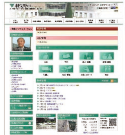
ホームページのリニューアル