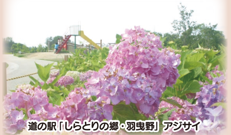
道の駅「しらとりの郷・羽曳野」アジサイ

今年度は、第5次総合基本計画の折り返しの年であり、節目の年となります。また、私自身にとりましても二期目の任期を総括する重要な1年であります。「一步、さらに一步前へと、着実に踏み出す」という意気込みで羽曳野の飛躍に向け、「次代のはびきのづくり」に取り組んでまいります。市政の主役は市民であることは言うまでもありません。私は、その舵取り役として最終的に決断を下すという責任の重大さを肝に銘じ、最善の熟慮を尽くし、ためらうことなく即時実行する覚悟を持って、これからも市政運営に臨んでまいります。今後とも、子どもから高齢者まで誰もが、「羽曳野に住んでよかった、今後とも住み続けたい」と感じていただけるような『ふるさと羽曳野』づくりの実現に向けて、市政運営に全力を傾注してまいります。