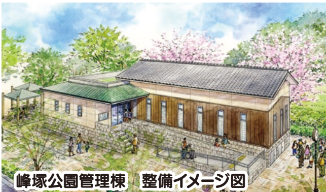
峰塚公園管理棟 整備イメージ図