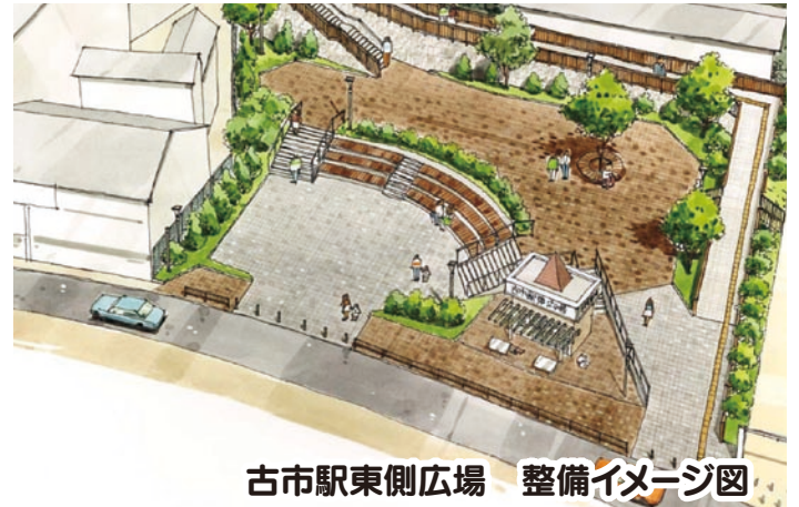
古市駅東側広場 整備イメージ図