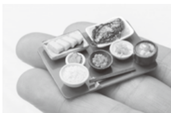
(左) ミニチュアフード展示作品。 (右) ミニチュアフード制作体験サンプル作品。 バケットサンド(15mm)

会場 市役所 東玄関横ギャラリーはびきの(ギャラリー展示室) 期間 4月4日(土)～5月31日(日)【入館無料】 開館 9:00～17:00(土・日も開館 ※休日は休館)