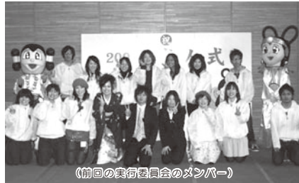
(前回の実行委員会のメンバー)

羽曳野市では、第52回羽曳野市成人式を、若いみなさんといっしょに企画、立案したいと考えています。プロデュースしてみようと思われる方は社会教育課までご連絡ください。