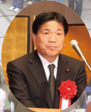
谷畑 孝 衆議院議員