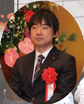
橋下 徹 大阪府知事