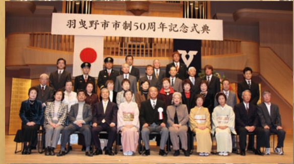
平成 20 年度市民表彰受賞の皆様