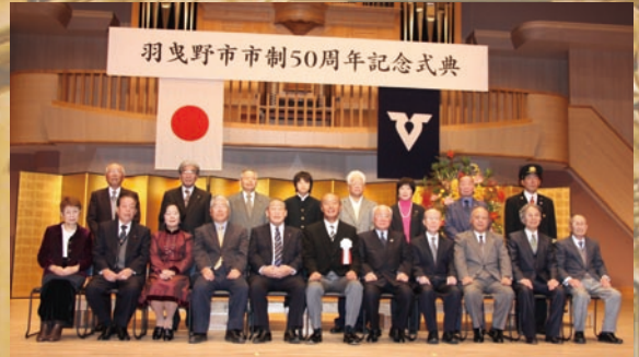
市制 50 周年記念表彰受賞の皆様