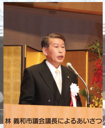
林 義和市議会議長によるあいさつ