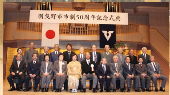
平成 20 年度市民表彰受賞の皆様