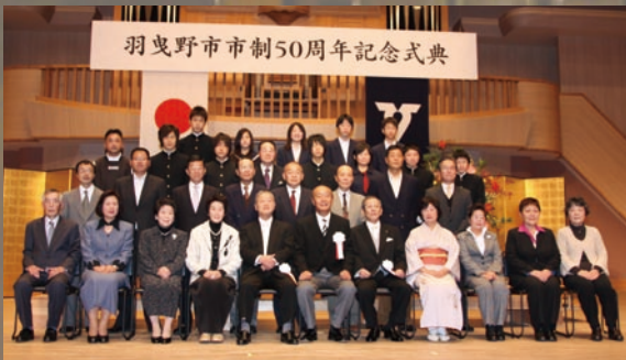
平成 20 年度教育委員会表彰受賞の皆様