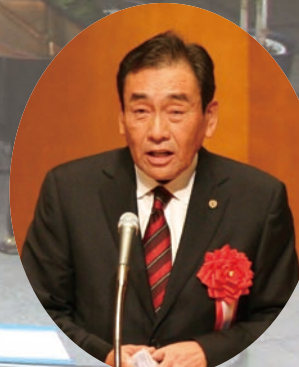
阪倉 久晴 府議会議員