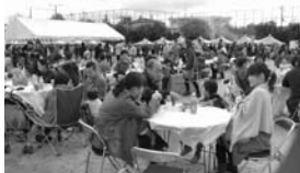
▲第16回むかいのミートミートフェアの様子。第17回も数多くのコーナー、屋台などで楽しんでいただけます。

日時 11月17日(日)(雨天決行) 10:00～14:30 会場 市立青少年運動広場(南食ミートセンター前) 向野3-1-33 近鉄高鷲駅から南へ徒歩20分