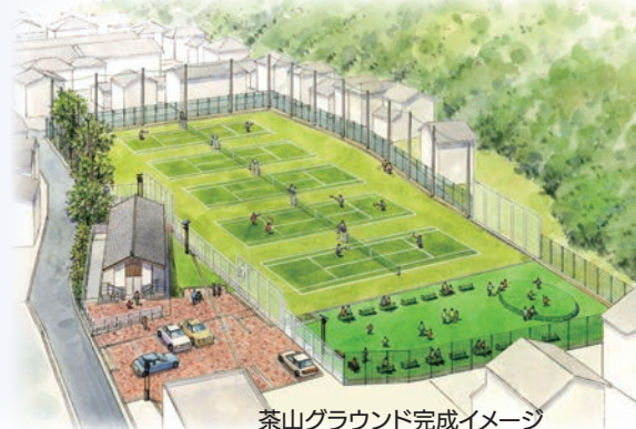
茶山グラウンド完成イメージ