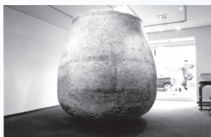
▲文化・文明の起源である埴(は)から、感傷性をはじめさまざまな感情を“埴”で立体表現された作品展です。