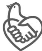
条例啓発 シンボルマーク