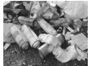
◀本市でも火災事故が発生しています。

また、柏羽藤クリーンセンター(焼却場)でもスプレー缶などの破裂による火災が発生しています。