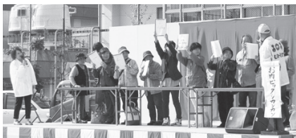
▲第17回の様子。第18回も催し、食事、買い物を楽しんでください。

主催 むかいの南食ミートミートフェア実行委員会 (向野2-8-2) ☎ 954-8201 FAX 955-7042 後援 近畿農政局・大阪府・羽曳野市・羽曳野市教育委員会・羽曳野市観光協会・羽曳野市人権啓発推進協議会・世界人権宣言羽曳野連絡会・羽曳野市企業人権連絡会・羽曳野市雇用開発協会・羽曳野市商工会・(株)みのりの里・大阪南農業協働組合・(医) 鳩生診療所・NPO法人サポートネットワークぬくもり