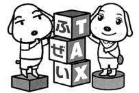
府税マスコットキャラクター「タビコ」&「みらい」

大阪府では、「税の公平性の確保」と「自主財源である府税収入の確保」が重要なことから、3月を「税込確保重点月間」と定め、貴重な税収の確保に努めます。