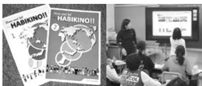
▲教材を使った授業の様子