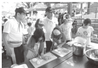
▲子どもたちによる、カレー作りの様子

【記載事項】 住所・参加者氏名・保護者氏名・電話番号・緊急連絡先(携帯番号)・ 年齢・学校名・学年・性別・生年月日 〒583-8585 社会教育課 羽青指キャンプ事務局宛(市役所別館3階) ☎ 958-1111 内線 4450