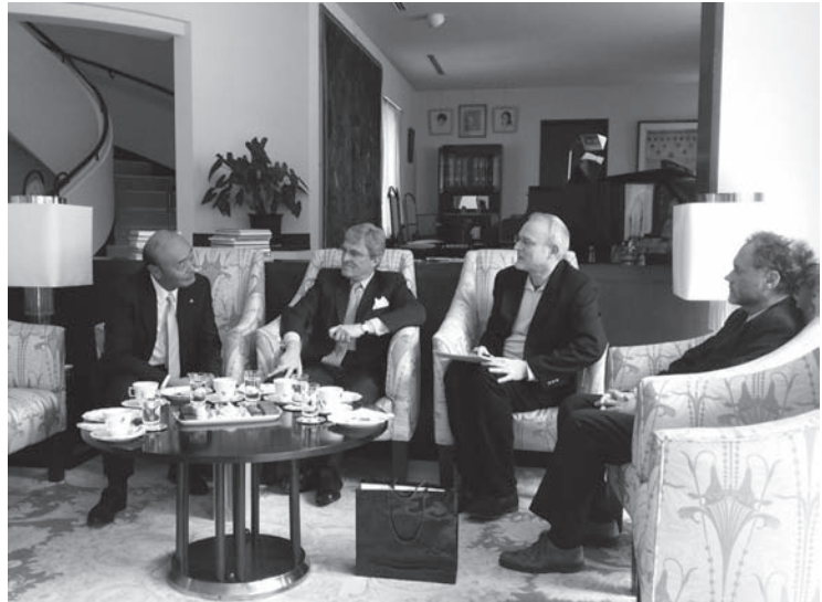
建築家榎文彦氏の設計による大使館邸での会談

桜がつぼみをふくらませはじめた3月の終わりに、ベルンハルト・ツイ ムブルグ駐日オーストリア大使を、今年7月に開催予定の「ウィーン市 13 区ヒーティング友好交流都市 20周年記念式典」に来賓としてお招きす るため、東京港区にある、オーストリア大使館を訪問してまいりました。