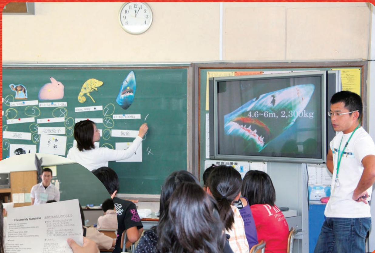
外国語活動の授業風景 市若手職員もサポートで大奮闘