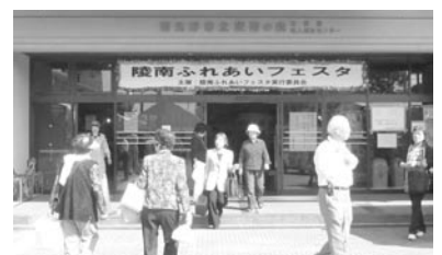
▲陵南ふれあいフェスタの様子

陵南の森総合センターでは10月3日～9日まで、陵南の森公民館グループ連絡協議会と陵南の森老人福祉センタークラブ連絡協議会の合同で開催されました。また、8日・9日のメインイベントである、市民カラオケ大会や、クラブ発表会・作品展示に市民4,000人が参加され、芸術の秋を楽しまれました。