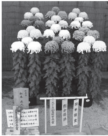
総合優勝 松本 正人(大菊)