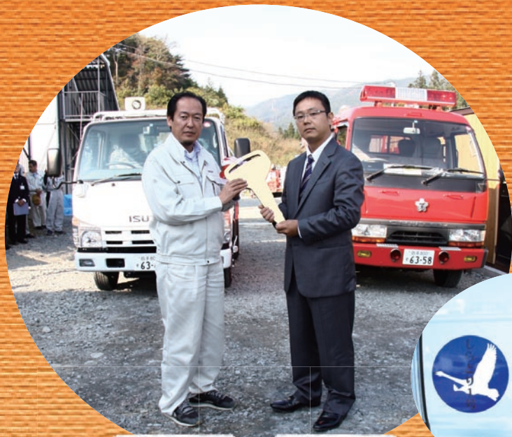
陸前高田市 戸羽 太 市長