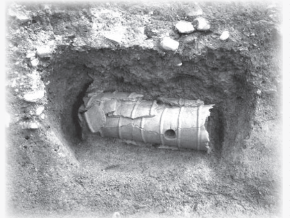
安閑天皇陵古墳円筒棺出土状況

主な展示物は安閑天皇陵古墳の円筒棺に使用された円筒埴輪や城不動坂古墳から発見された埴輪や須恵器などです。