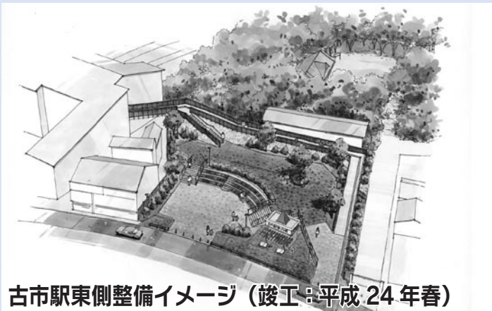
古市駅東側整備イメージ(竣工:平成24年春)

世界遺産登録をめざす、古市古墳群などの史跡めぐりや竹内街道散策など「羽曳野の歴史」をめぐる拠点として、古市駅前の広場を活用できるように。また、お友達と出かける時の待ち合わせスポットとしてご利用いただければ!