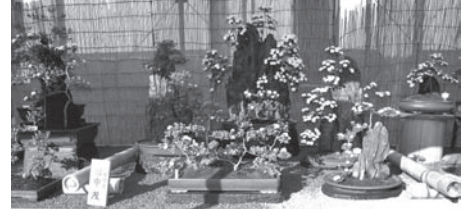
農林水産大臣賞 田中 茂(盆栽)