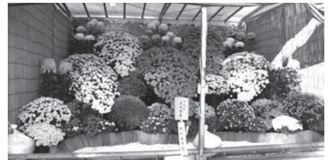
財務大臣賞 久門 末男(特作花壇)