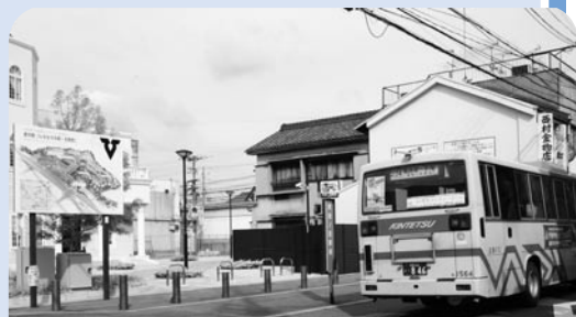
近鉄南大阪線恵我ノ荘駅南側